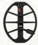
EQX 15 Smart Coil

Bobina a doppia D da 15 x 12 pollici per maggiore profondità e copertura del terreno